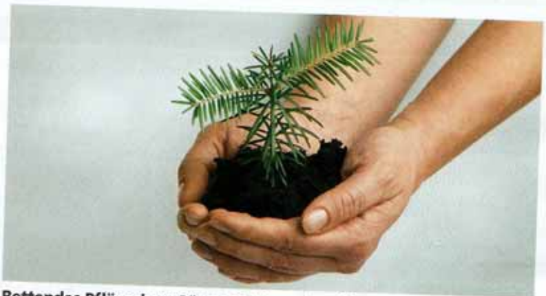
Rettendes Pflänzchen: Bäume speichern langfristig Kohlendioxid (CO 2 )

Era Carbon Offsets bietet als junges Unternehmen zwar eine sehr spekulative Aktie. Die Gewinnchancen sind auf Grund des wachsenden CO 2 -Zertifikatemarkts jedoch gegeben.